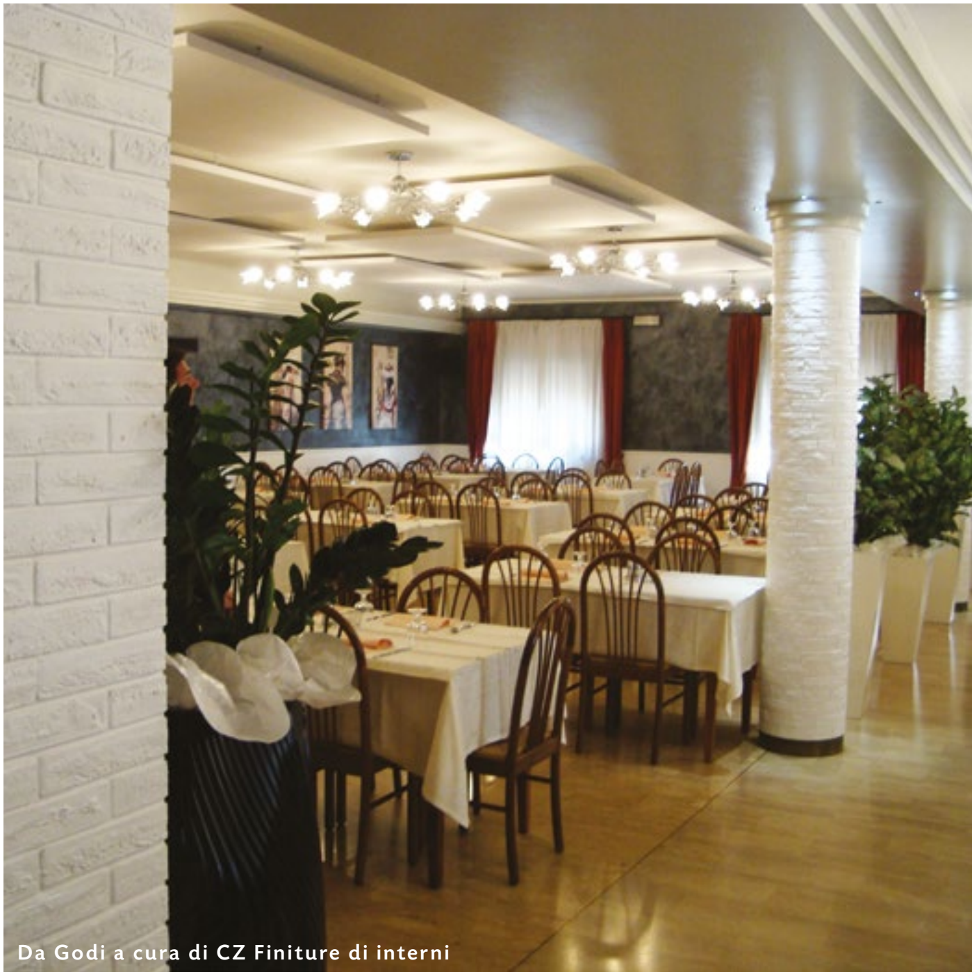
Da Godi a cura di CZ Finiture di interni